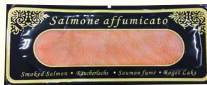
SALMONE NORVEGESE PREAMFETTATO L'INEDITO 500G