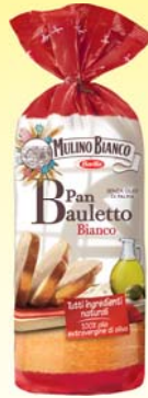
PANE BIANCO MULINO BIANCO 400G