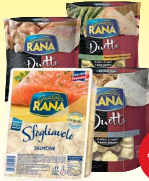
PASTA RIPIENA RANA SFOGLIAVELO/ DUETTO VARI TIPI 250G