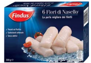
FIORI DI NASELLO FINDUS 300G