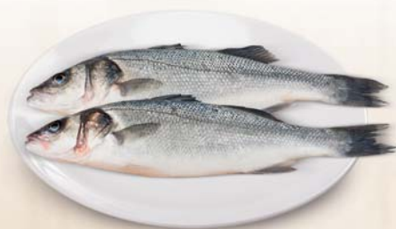
SPIGOLA 1500/2000 ALL. GRECIA

REPARTO PRESENTE SOLO A CORATO E MOLFETTA