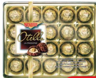
PRALINE OTELLO NOVI 240G