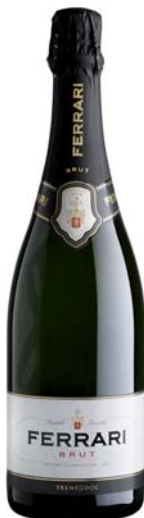
SPUMANTE DOC BRUT FERRARI 75CL