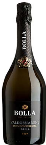
SPUMANTE PROSECCO DOCG BOLLA 75CL