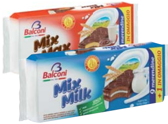
MERENDINA BALCONI MIX MAX/ MIX MILK 350G