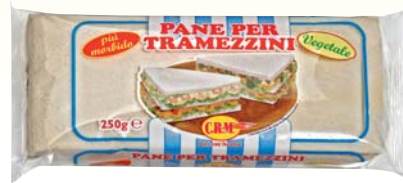
PANE PER TRAMEZZINI C.R.M. X5 250G