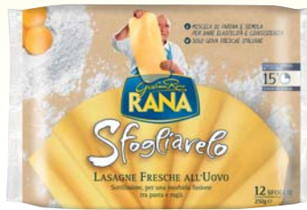
LASAGNE SFOGLIAVELO RANA 250G