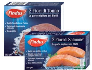
FIORI DI SALMONE 200G/ FIORI DI TONNO 230G FINDUS