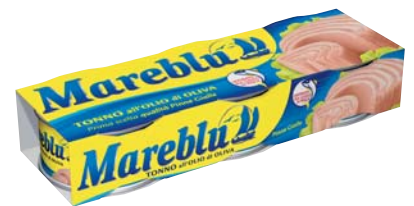
TONNO ALL'OLIO D'OLIVA MAREBLÙ 80G X3