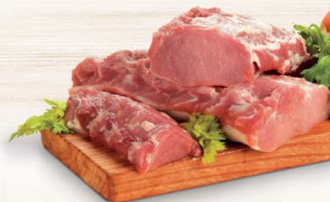
FILONE DI SUINO CONGELATO BALDI 5 KG C.A. AL KG