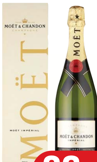
CHAMPAGNE MOËT & CHANDON 75CL