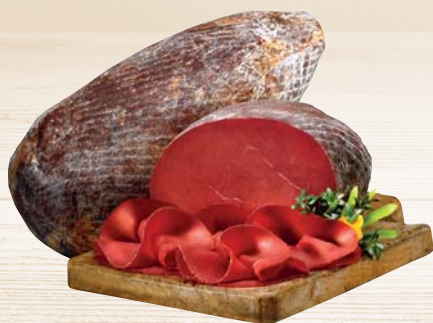
BRESAOLA DELLA VALTELLINA IGP SOTTOFESA AL KG