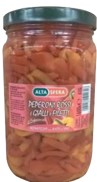
PEPERONI A FILETTI ALTASFERA 1,6KG