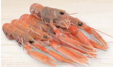
SCAMPI 20/30 1KG - 750G NETTI