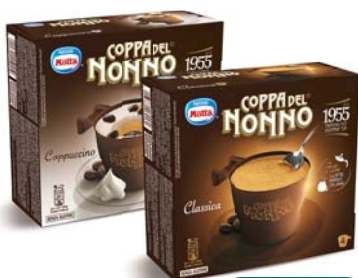
COPPA DEL NONNO MOTTA CLASSICA 288G /CAPPUCCINO 300G