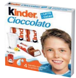
BARRETTE DI CIOCCOLATO AL LATTE KINDER X4 50GR