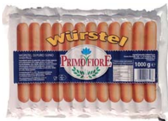
WURSTEL PRIMO FIORE SUINO+ 1KG