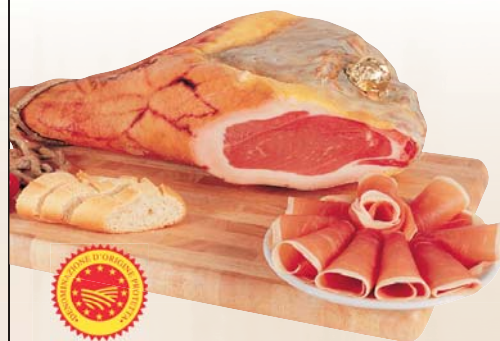
PROSCIUTTO CRUDO DI PARMA DOP SENZ'OSSO AL KG