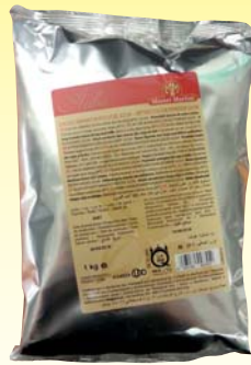
CACAO AMARO IN POLVERE M/MARTINI 1KG