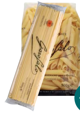
PASTA DI SEMOLA GAROFALO FORMATI NORMALI 500G