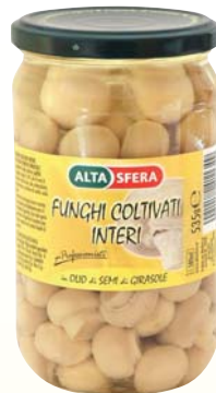
FUNGI COLTIVATI INTERI ALTASFERA 535G