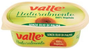
MARGARINA VALLÈ NATURALMENTE 250G