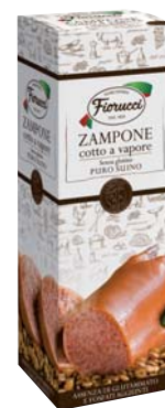
ZAMPONE FIORUCCI 1KG