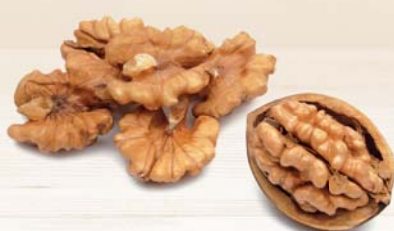
NOCI JUMBO HARTLEY CALIFORNIA SBIANC. 32 + (25KG) AL KG