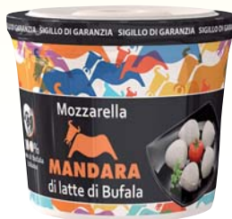
MOZZARELLA MANDARA BUFALA VASO 500G