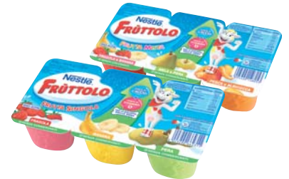
YOGURT FRUTTOLO NESTLÉ GUSTI ASSORTITI 50G X6