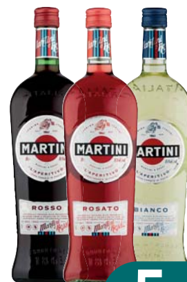
MARTINI BIANCO/ ROSSO/ ROSATO 1L