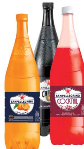
BIBITE SANPELLEGRINO GUSTI ASSORTITI 1,25L