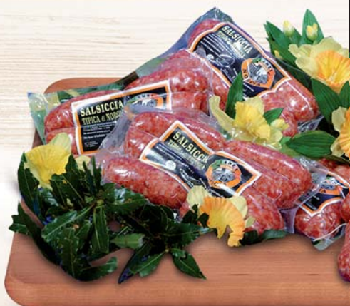
SALSICCIA DI NORCIA LANZI SV - AL KG