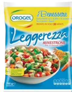
MINISTRONE LEGGEREZZA OROGEL 750G