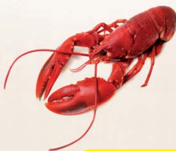
ASTICE FRESCO 400/700 CANADA