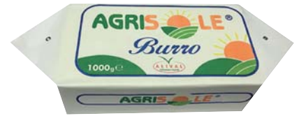
BURRO AGRISOLE ALIVAL 1KG