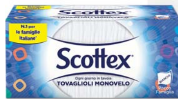
TOVAGLIOLI 1 VELO SCOTTEX FAMILY PACK