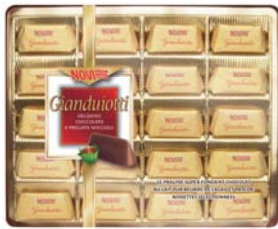
GIANDUIOTTI NOVI X20 195G