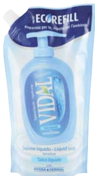
SAPONE LIQUIDO VIDAL 500ML