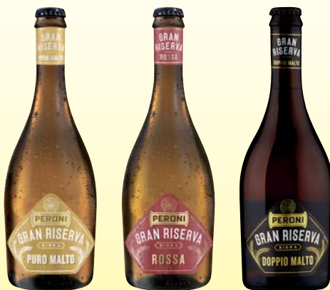
BIRRA PERONI GRAN RISERVA PURO MALTO/ ROSSA/ DOPPIO MALTO 50CL