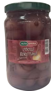
CIPOLLE ALTASFERA BORETTANE 1,6KG