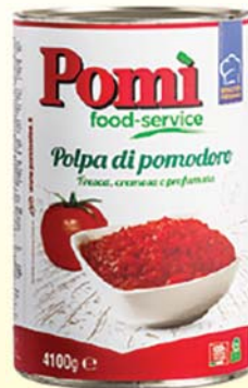
POLPA DI POMODORO POMI 4100G