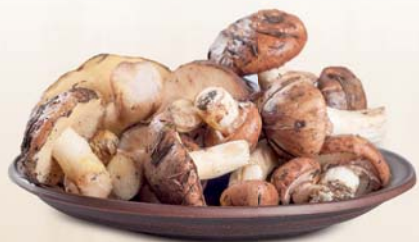
FUNGHI CARDONCELLI (IMBALLO INTERO) AL KG