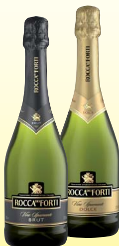
SPUMANTE ROCCA DEI FORTI BRUT /DOLCE / ROSSO 75CL