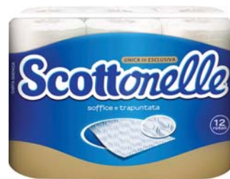
CARTA IGIENICA SCOTTONELLE X12 ROTOLI