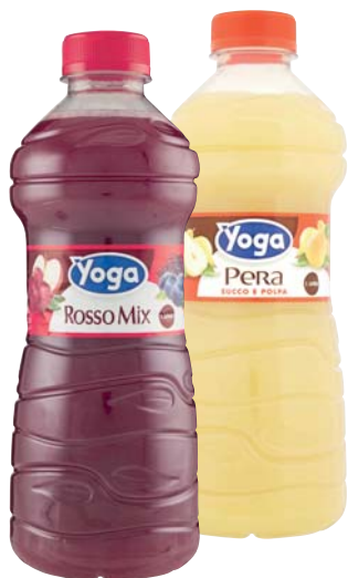
NETTARE/SUCCO YOGA GUSTI ASSORTITI 1L