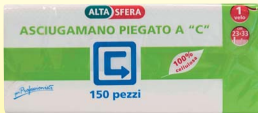
ASCIUGAMANO ALTASFERA A C 1 VELO 150PZ