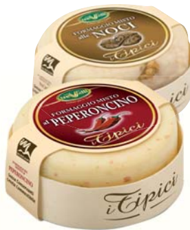
FORMAGGIO MISTO TREVALLI NOCI/ PEPERONCINO/ OLIVE 180G