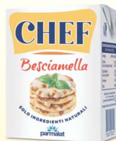
BESCIAMELLA CHEF 200ML