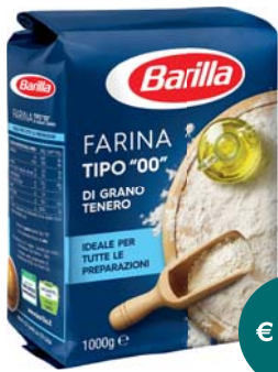
FARINA 00 BARILLA 1KG