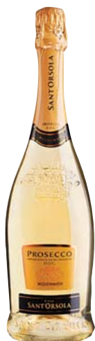
PROSECCO DOC SANT'ORSOLA LUXURY 75CL