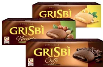
GRISBI CLASSIC VICENZI VARI GUSTI 150G