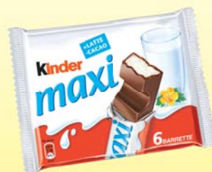
BARRETTE KINDER FERRERO MAXI X6 126G