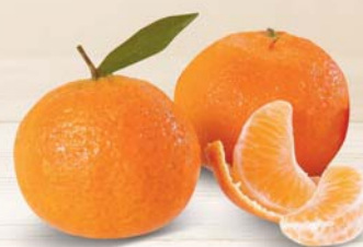
CLEMENTINE CAL 2/3 (IMBALLO INTERO) AL KG