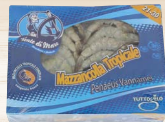
MAZZANCOLLE TROPICALI 21/30 1KG