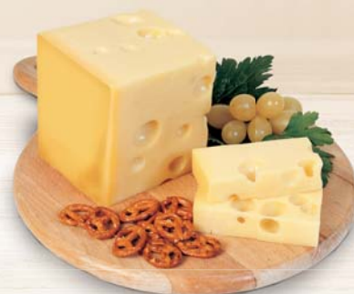
EMMENTALER DOP AL KG