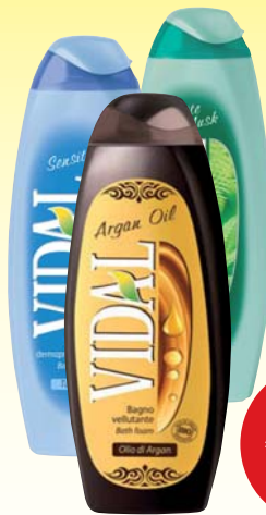
BAGNOSCHIUMA VIDAL VARI TIPI 500ML