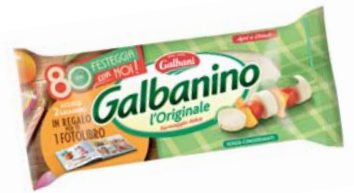
GALBANINO GALBANI 270G