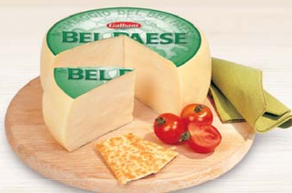
FORMAGGIO BEL PAESE GALBANI 2,5KG AL KG