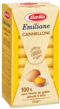
CANNELLONI ALL'UOVO BARILLA 250G