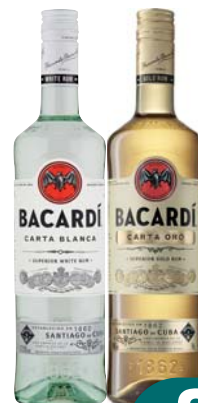
RUM CARTA ORO/BLANCA BACARDI 70CL