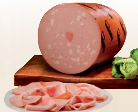
MORTADELLA P/S CUOR DI PAESE IBS AL KG