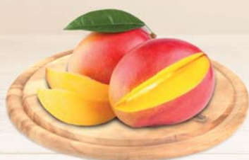
MANGO (IMBALLO INTERO) AL KG