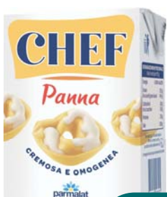
PANNA DA CUCINA CHEF 200ML