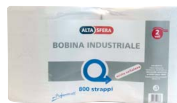
BOBINA INDUSTRIALE ALTASFERA X 2 ROTOLI