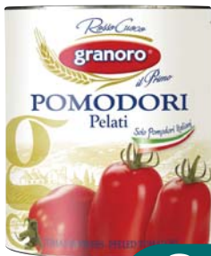
POMODORI PELATI GRANORO 800G