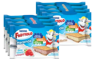
MERENDA FRUTTOLO FIORDILATTE/FRAGOLA 104G