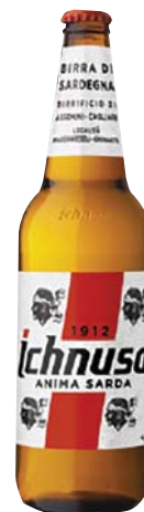
BIRRA ICHNUSA 66CL