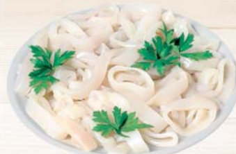
ANELLI DI TOTANO BRASMAR 500G