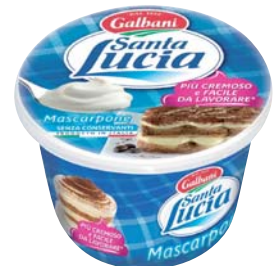
MASCARPONE GALBANI 500G