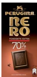
TAVOLETTE DI CIOCCOLATO NERO PERUGINA VARI TIPI 100G