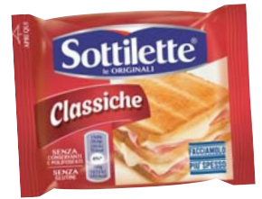
SOTTILETTE CLASSICHE/FILA E FONDI 400G