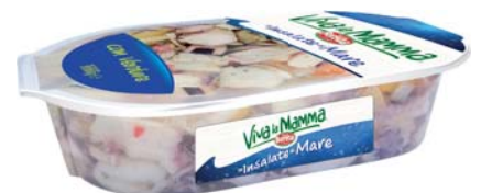
INSALATA DI MARE VIVA LA MAMMA 1KG