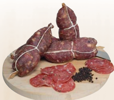
SOPRESSATA LUCANA FIOR DI SALUMI 350G C.A. AL KG