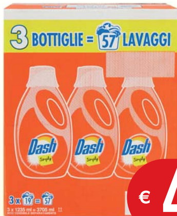
DASH SIMPLY LIQUIDO 19 LAVAGGI X3 FRESCHEZZA ESTIVA/ REGOLARE