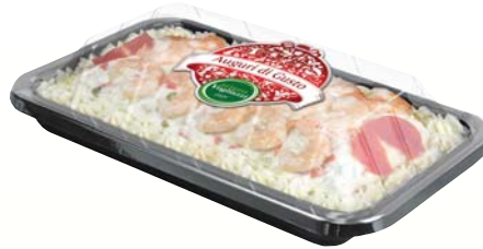
INSALATA RUSSA GHIOTTA VOGLIAZZI CON GAMBERI 650G