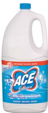
CANDEGGINA ACE REGOLARE 3LT