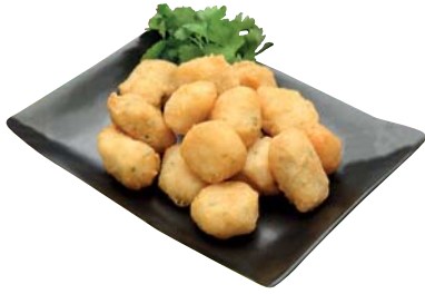
BOCCONCINI DI BACCALÀ 1KG