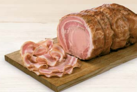
PORCHETTA ARROSTO MOTTA 4,5KG AL KG