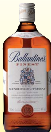
WHISKY BALLANTINE'S 70CL