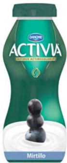
YOGURT DA BERE ACTIVA FRAGOLA E KIWI/ MIRTILLO 195G