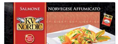
SALMONE NORVEGESE KV NORDIC 300G ASTUCCIO