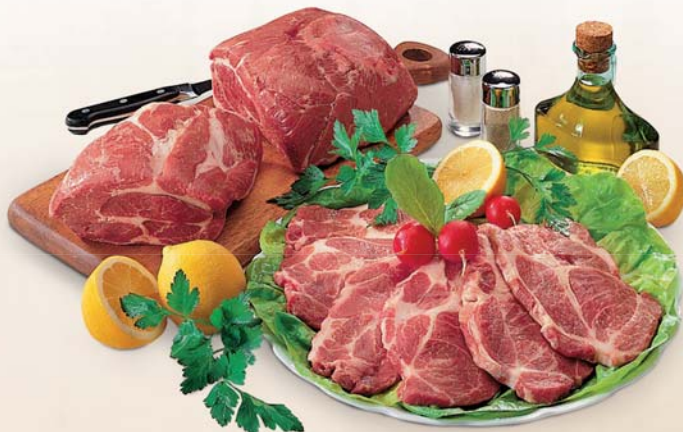
COPPA SUINO CON OSSO A FETTE CONF. 1KG - AL KG