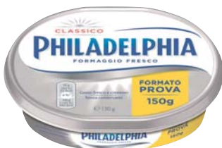
PHILADELPHIA CLASSICO 150G