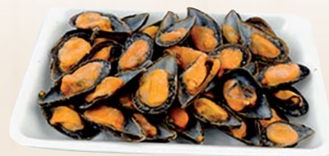
COZZE 1/2 GUSCIO BRASMAR 900G