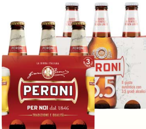
BIRRA PERONI CLASSICA /3.5 33CL X3