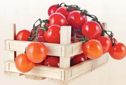
POMODORO CILIEGINO (IMBALLO INTERO) AL KG