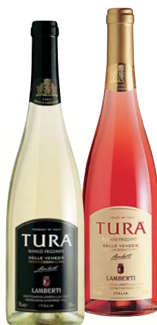
VINO IGT BIANCO/ROSATO/ ROSSO FRIZZANTE TURÀ LAMBERTI 75CL