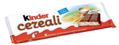
KINDER CEREALI FERRERO X6 141G