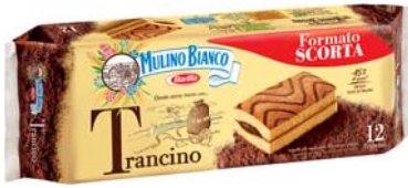
TRANCINO MULINO BIANCO X12 396G