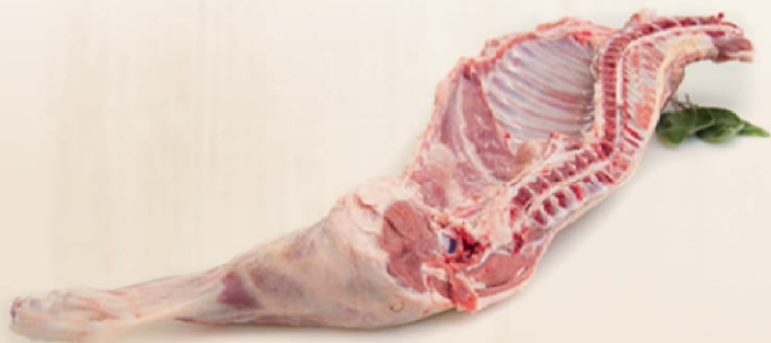
AGNELLO INTERO CARCASSA 7/9 AL KG