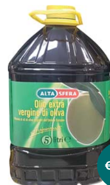
OLIO EXTRA VERGINE DI OLIVA ALTASFERA 5L