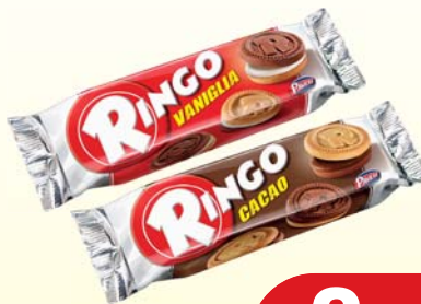
PAVESI RINGO SNACK BAR CACAO/VANIGLIA