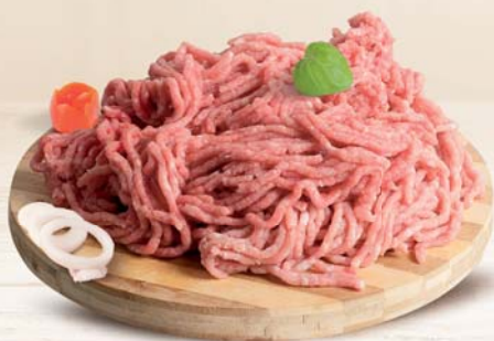
TRITATO MISTO BOVINO/ SUINO 600G C.A. AL KG