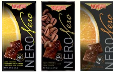
TAVOLETTE DI CIOCCOLATO NERO NOVI VARI GUSTI 75G