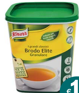
BRODO ELITE GRANULARE KNORR 1,2KG