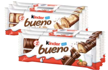
KINDER BUENO CLASSICO /WHITE 43G X3