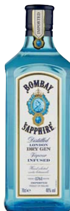
GIN BOMBAY SAPPHIRE LONDON DRY 70CL