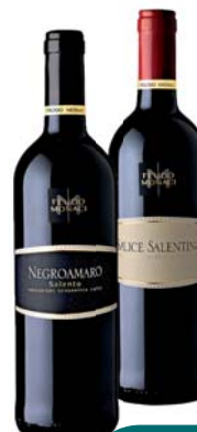
VINO IGT/DOC FEUDO MONACI FIANO DI AVELLINO/ PRIMITIVO/ SALICE SALENTINO/ NEGROAMARO 75CL