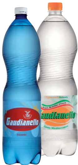
ACQUA GAUDIANELLO EFFERVESCENTE NATURALE /FRIZZANTE 1,5L