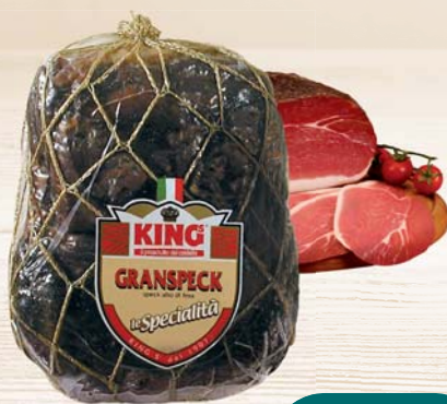
GRANSPECK INTERO KING'S AL KG