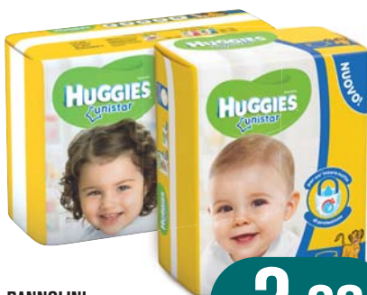
PANNOLINI HUGGIES UNISTAR MISURE ASSORTITE