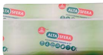
ASCIUGAMANO ALTASFERA A 2 VELI 150PZ