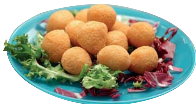
MOZZARELLE PANATE CGM 1KG