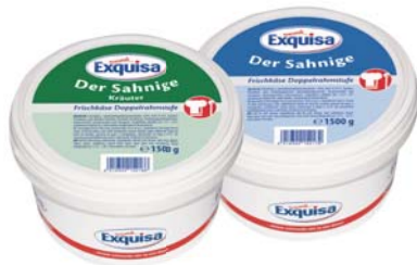
FORMAGGIO FRESCO CLASSICO/ALLE ERBE EXQUISA 1,5KG