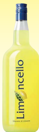
LIMONCELLO FIUME 2L