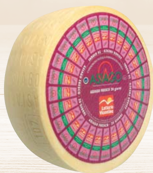
ASIAGO DOP LATTERIE VICENTINE 1/4 SV - 3,5KG AL KG