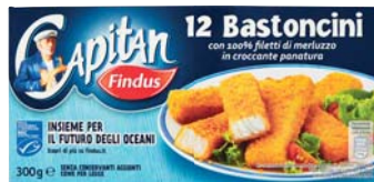
BASTONCINI DI MERLUZZO FINDUS X12 300G