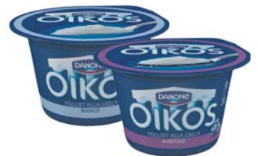
YOGURT OIKOS ZERO DANONE VARI GUSTI 150G