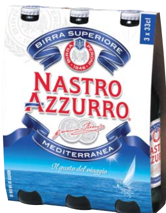
BIRRA NASTRO AZZURRO 33CL X 3