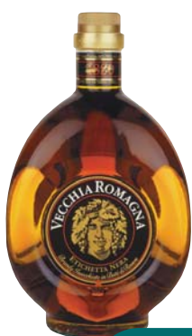
BRANDY VECCHIA ROMAGNA ETICHETTA NERA 38° 70CL