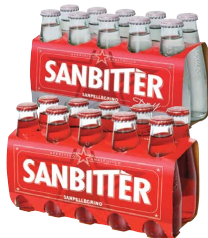
SANBITTER SAN PELLEGRINO CLASSICO/DRY 10CL X10