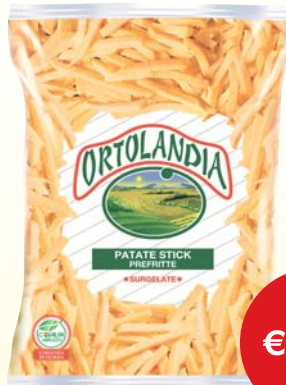
PATATE STICK SURGELATE ORTOLANDIA 2,5KG