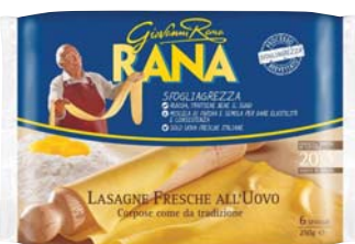
LASAGNE SFOGLIAGREZZA RANA 250G