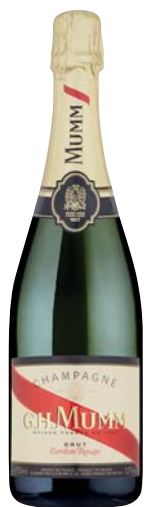
CHAMPAGNE CORDON ROUGE MUMM 75CL