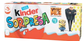
KINDER SORPRESA FERRERO TRIPACK 128G