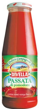
PASSATA DI POMODORI DIVELLA 680G