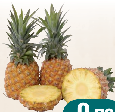
ANANAS CAL 7/8 AL KG