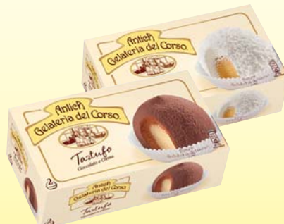
TARTUFO ANTICA GELATERIA DEL CORSO CACAO/PANNA 160G