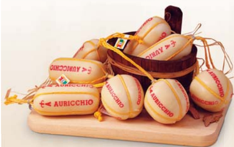
PROVOLETTE/ SALAMINI AURICCHIO 800G/ 1,3KG AL KG