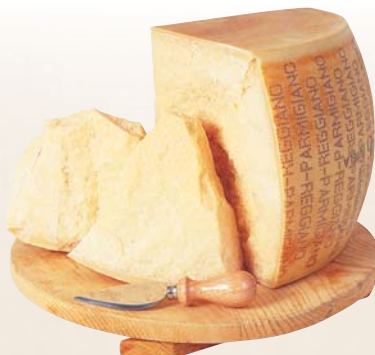
PARMIGIANO REGGIANO DOP 1/8 SV 4,5KG AL KG