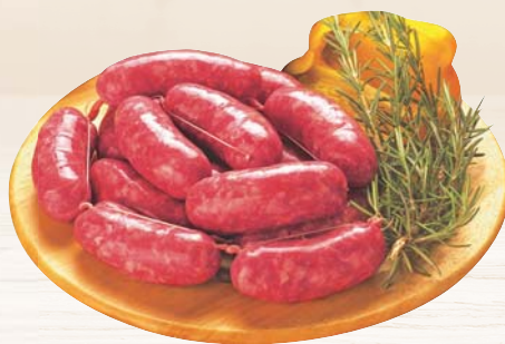
SALSICCOTTO CALABRESE DOLCE/ PICCANTE AL KG