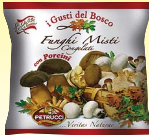
FUNGHI MISTI CON PORCINI PETRUCCI 1KG