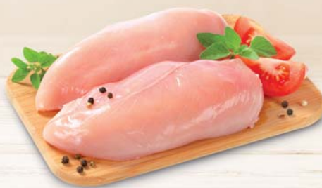
POLLO PETTO BIANCO INTERO AL KG