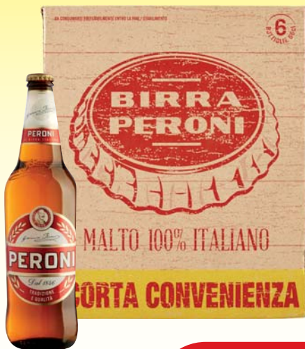
BIRRA PERONI 66CL X6