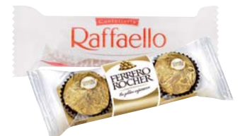
ROCHER/RAFFAELLO FERRERO X3