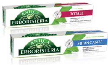
DENTIFRICIO ANTICA ERBORISTERIA VARI TIPI 75ML