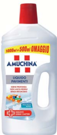
DETERSIVO AMUCHINA PAVIMENTI LIQUIDO 1L+500ML