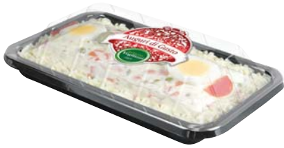
INSALATA RUSSA GHIOTTA VOGLIAZZI CLASSICA 650G