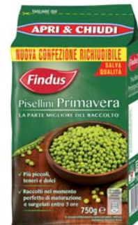
PISELLINI PRIMAVERA FINDUS 750G