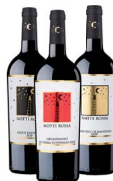
VINI DOP NOTTE ROSSA PRIMITIVO/ SALICE SALENTINO/ NEGROAMARO 75CL