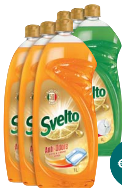
DETERSIVO PIATTI SVELTO LIMONE VERDE/ ACETO 1L X3