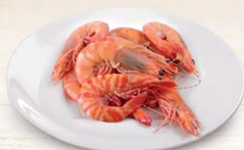
GAMBERONE ARGENTINO L1 CONGELATO A BORDO 2KG