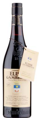
VINO ELISIR GAMBRINUS 70CL