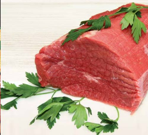
GIRELLO/MAGATELLO DI BOVINO ADULTO AL KG