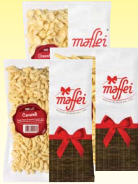
PASTA FRESCA DI SEMOLA MAFFEI VARI TIPI 500G