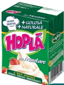
PANNA DA MONTARE HOPLÀ VEGETALE 200ML