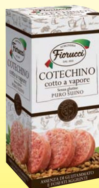
COTECHINO COTTO FIORUCCI 500G