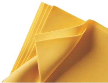
SFOGLIA DI PASTA PRONTA GOURMET 2KG