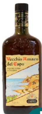
AMARO VECCHIO AMARO DEL CAPO 70CL