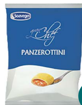
PANZEROTTINI SOAVEGEL 40 PZ 1KG