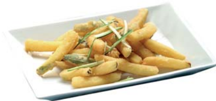
ZUCCHINE STICK PASTELLATE 1KG