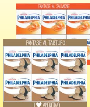
FANTASIE PHILADELPHIA SALMONE/ TARTUFO 25G X 6