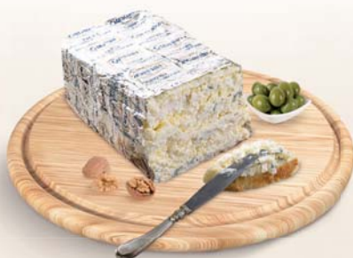
ARMONIA GORGONZOLA MASCARPONE CADEMARTORI 1,4KG C.A. AL KG